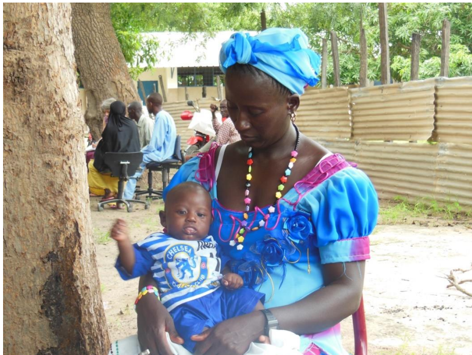
Deltagere på medlemsmøde i Sintet, Gambia