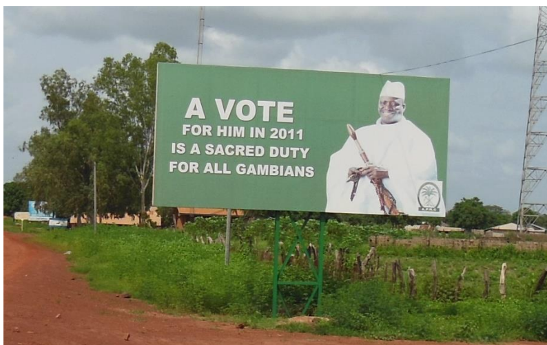
En valgplakat, der vist taler for sig selv!

Nok det mest urovækkende er hans udtalelse om, at Mandingue-folket skal bekæmpes. Mandingue er den talrigeste befolkningsgruppe i Gambia, men det er præsidentens etniske gruppe, Jola, der sidder på magten.