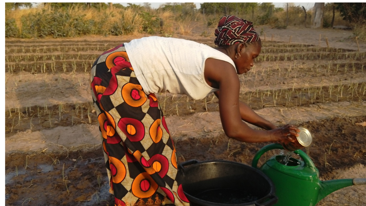
Løgdyrkning på COLUFIFAs nyindhegnede jordstykke.

I forbindelse med projektet dyrkede COLUFIFA såsæd til ris sidste år. Resultaterne var blandede, da regnen ikke opførte sig som forventet. Men de planlægger at forsøge sig igen i år. Og ris står højt på dagsordenen i Senegal. Regeringen igangsatte sidste år en plan for fred og udvikling i Casamance – Projet Pôle de Développement de la Casamance (PPDC). Formålet er blandt andet at resocialisere de tidligere rebeller, især via jobskabelse for unge. Der indgår en del udbygning af veje, et nyt hospital (Hôpital de la Paix) samt indsættelse af yderligere to færger mellem Ziguinchor og Dakar, som blev indviet dagen efter min hjemrejse. Uddannelsessektoren skal styrkes i Casamance, og der er planer om at etablere en landbrugsskole i Sédhiou. Centralt i projektet står en satsning på at få dyrket ekstra 30.000 ha ris (svarende til et forventet udbytte på 260.000 t) samt 3.000 ha med grønsager. Størstedelen af finansieringen kommer fra Verdensbanken. Generelt satser regeringen kraftigt på fødevarer sikkerhed, således også i strategien for klimatilpasning. For nylig har der