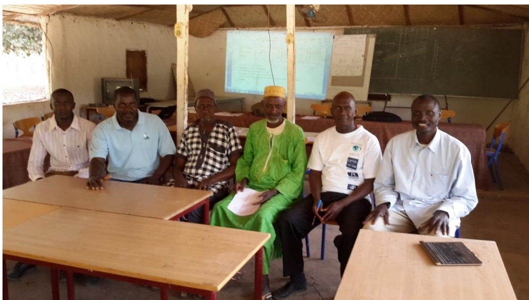
Container-gruppen i Senegal

Containeren forventes at ankomme til Banjul omkring den 4.12.2018.