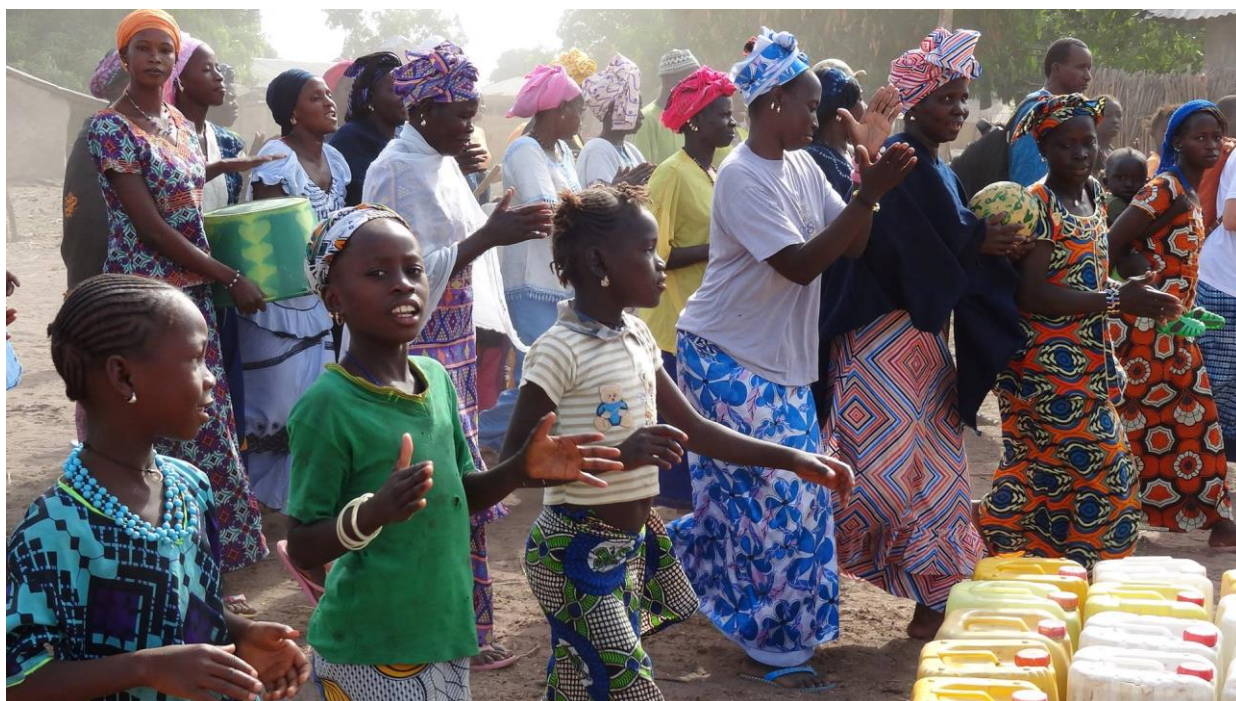
Festlig velkomst i landsbyen