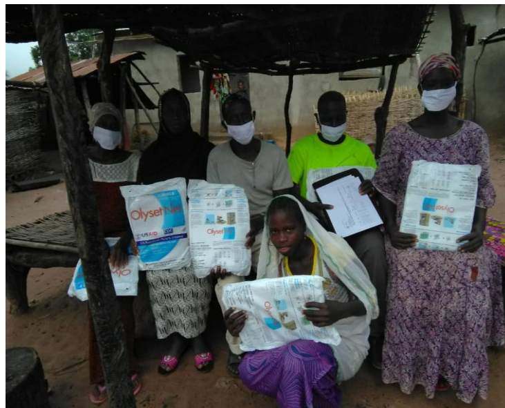
Hjemmebesøg under kampagnen mod COVID-19 og malaria.