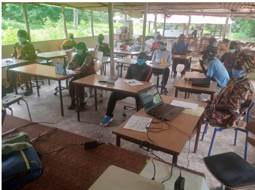
Undervisning i Faoune.

Budgettet rakte til 800 myggenet, eller 50 per union. Hver relais skulle fordele de 50 myggenet og gennemføre 5 familiebesøg i 5 forskellige landsbygrupper. Der skulle især fokuseres på gravide og ammende samt unge, der også i Senegal ofte bevæger sig meget omkring og overfører smitte til de gamle.