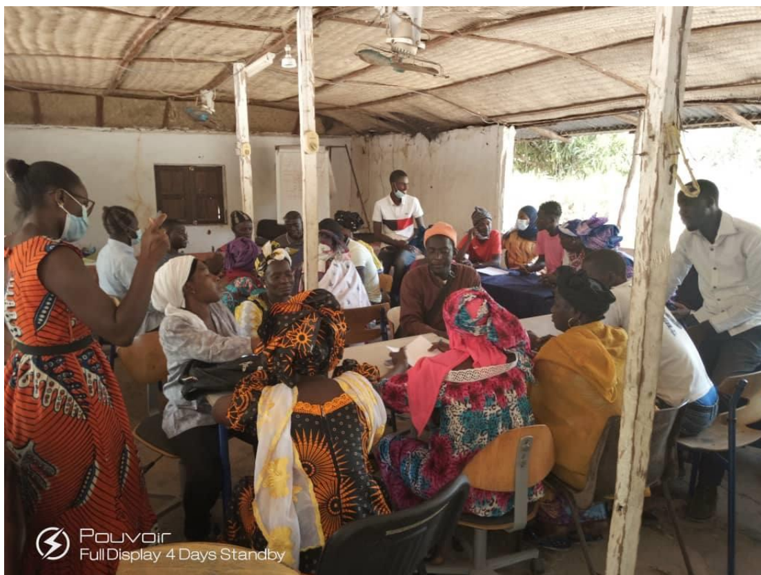
Undervisning af de lokale projektmedarbejdere.

I hver gruppe er der blevet udvalgt 3 unge til at sikre pasningen af dyrene på gruppens vegne. De betales gennem udbyttet af produktionen, og resten af udbyttet tilhører gruppen.