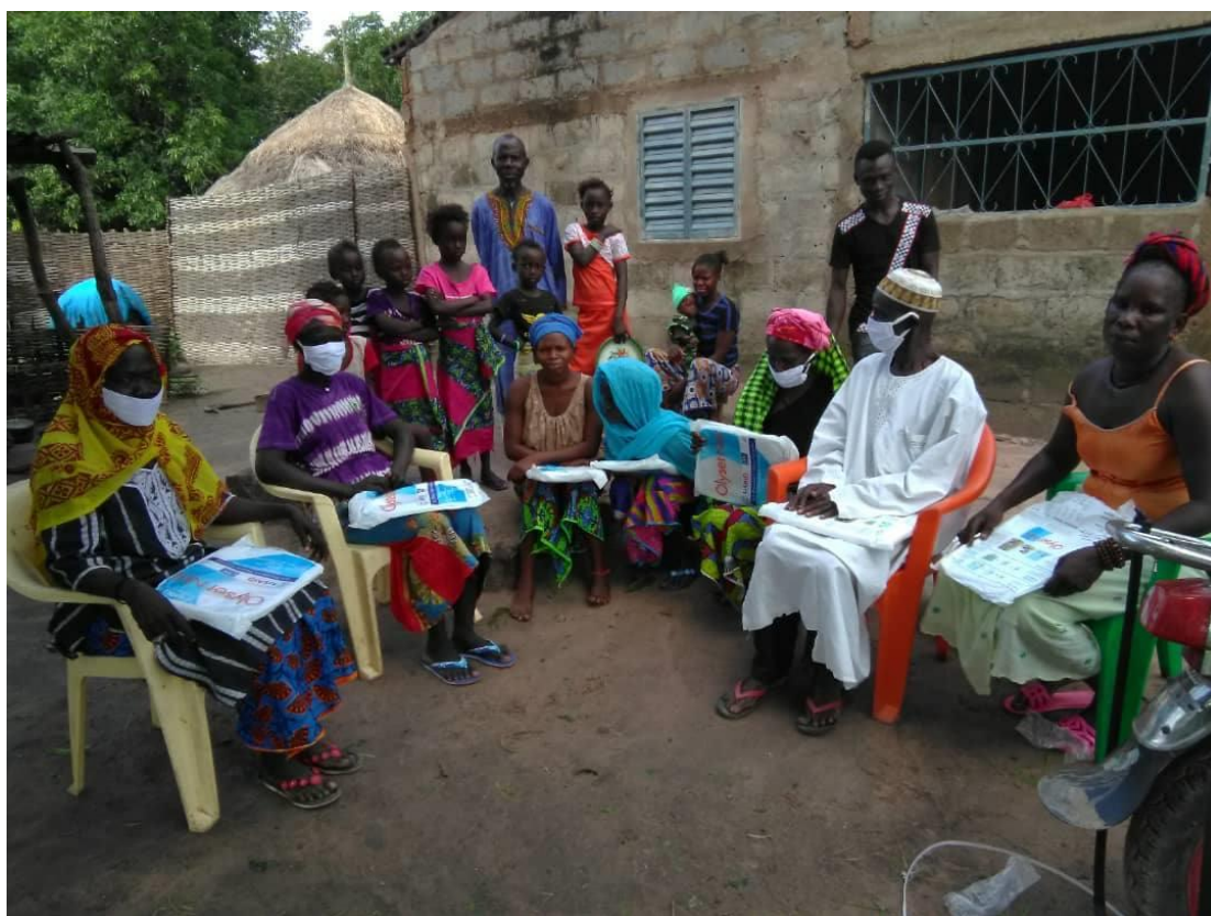
Forberedelser til kampagnen mod COVID-19 og malaria.